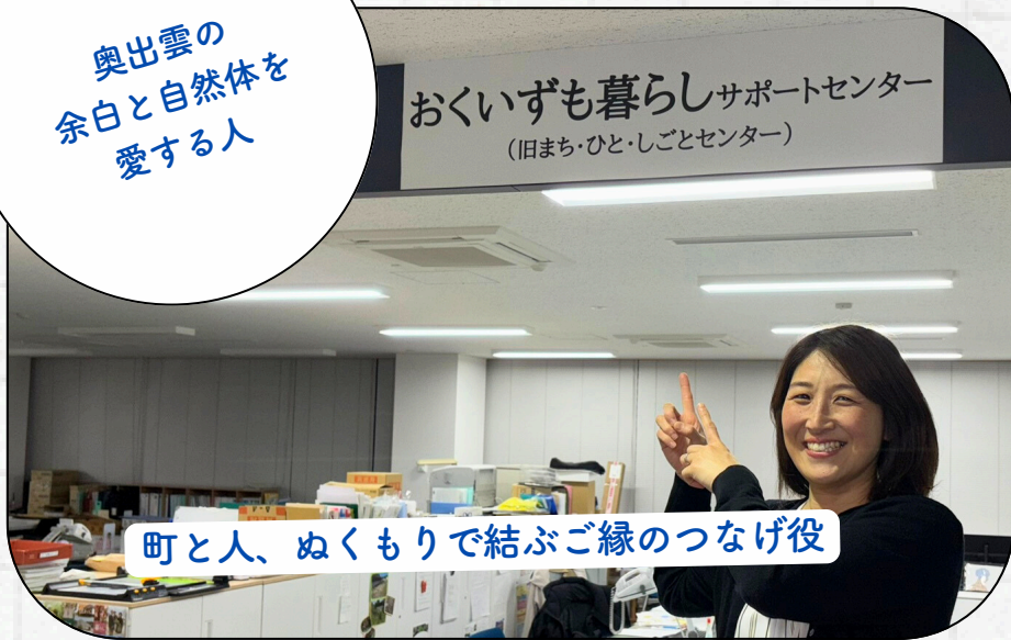
町と人、ぬくもりで結ぶご縁のつなげ役