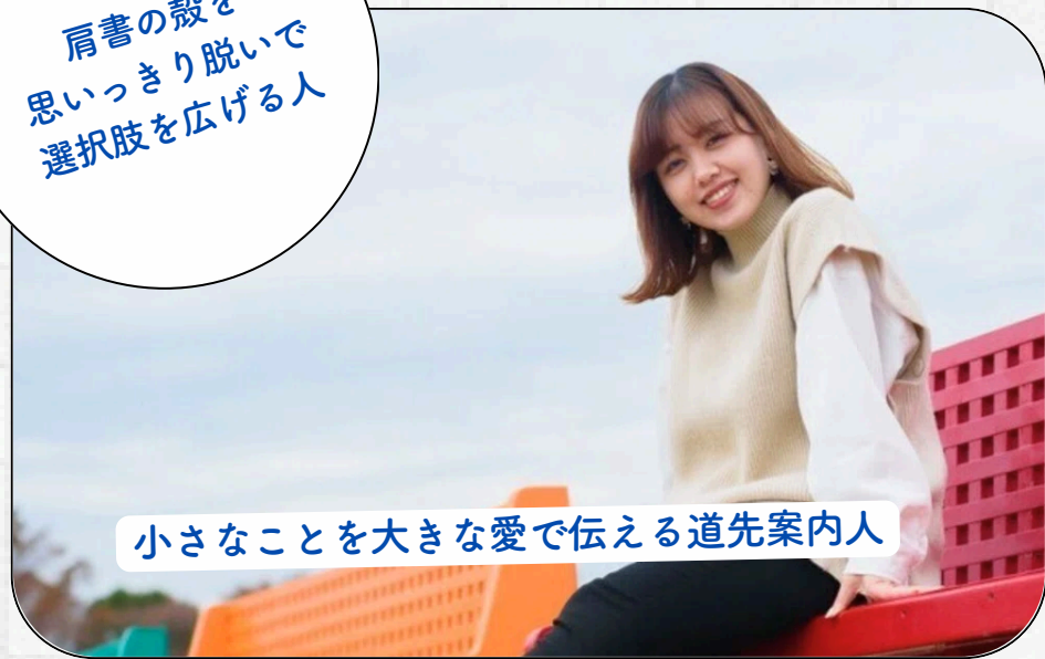
小さなことを大きな愛で伝える道先案内人