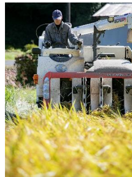
生産から販売まで一貫して行っています。

田舎が好き、ということもあり、作業場を見るだけでテンションが上がりますね。田んぼの畦で昼の弁当を食べることもありますが、本当にのどかで、自然と触れ合いながら仕事ができるということは、魅力的な環境だと実感しています。秋になると、自分で田植えをしたあとの稲の生長を見ることが楽しみです。自分で作ったお米をお客様や自分の家族に食べてもらえることはとても嬉しく、やりがいに繋がります。大型機械に乗るので、乗り物好きな人にとってはもってこいの仕事だと思います。車が好きな人が多い職場です。