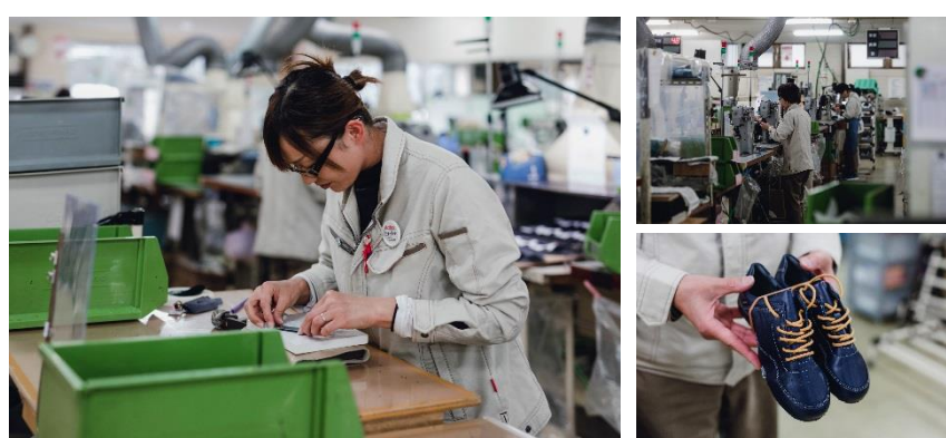
革靴のアッパー部を縫製していく

職場は作業中でも有線放送でBGMが流れるなど、みんなが働きやすい環境づくりにも取り組んでいます。お互い協力し、それぞれの家族との時間を大切にできるから、仕事にも気持ちよく向き合っている、そんな仲間が働く職場の休憩時間は、なおいっそう賑やかです。