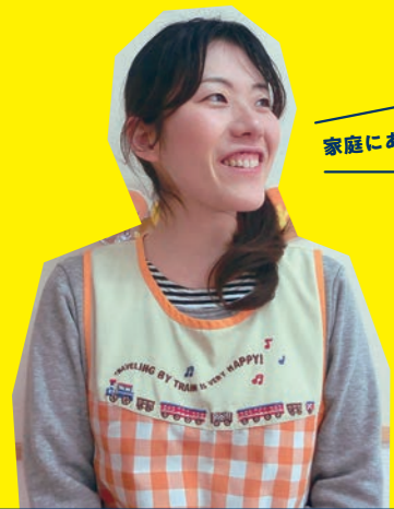
家庭にあるもので簡単に作れますよ!