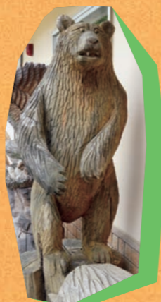
休憩スペースには 7-ya 7-maの足跡!