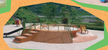
小子ども向けの遊具 石ツタ場